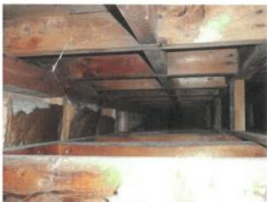
VUE PRÉSENCE D'HUMIDITÉ