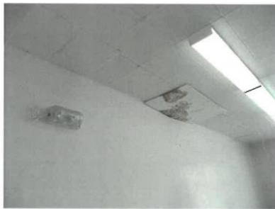
VUE TRACES D'HUMIDITÉ AU PLAFOND