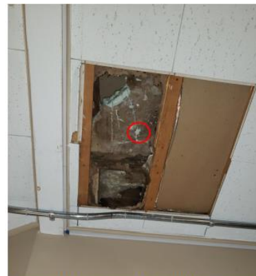
Photo 12 – Sondage #1, corridor à l'étage *observation de moisissures sur l'uréthane giclé