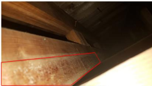
Photo 22 – Sondage #28, entre-plafond *observation de taches de moisissures sur quelques éléments de bois